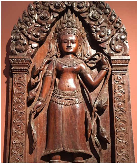
Ảnh 1. Tặng phẩm “Phù điêu vũ nữ thiên thần Apsara” của đoàn bóng đá Campuchia tặng Chủ tịch Hồ Chí Minh nhân dịp sang Việt Nam thi đấu giao hữu, tháng 7/1962.